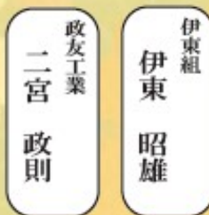
伊東組 伊東 昭雄