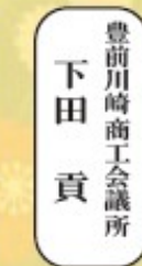
創作ランチ&カフェリタ 林 初枝