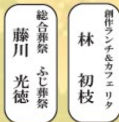
政友工業 二宮 政則