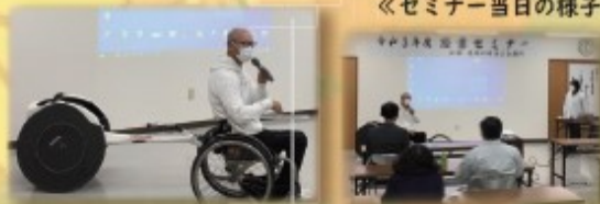
《セミナー当日の様子》

去る令和3年10月27日(水)18時より、当所会議室において、令和3年度経営セミナーを開催しました。