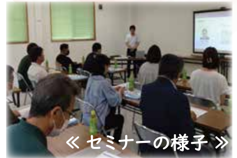
《 セミナーの様子 》

価格交渉セミナー・SNS活用セミナー・創業セミナー・事業継続計画(BCP)セミナーなど、今年度もビジネスの成長をサポートするために様々なセミナーを開催いたしました。ビジネスの課題解決や成長をサポートするために、ご興味のあるセミナーに参加してみたいはいかがでしょうか？