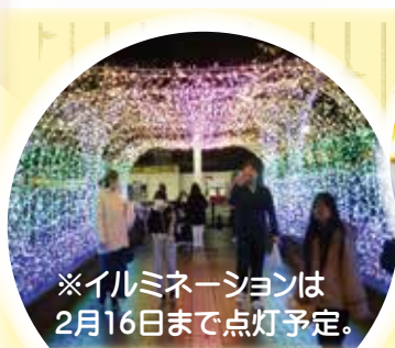
※イルミネーションは 2月16日まで点灯予定。

去る12月13日（金）、Kawasakiイルミネーション2024点灯式が行われました。点灯までのカウントダウンが始まると会場は期待に包まれ、点灯と同時に歓声が響き渡りました。川崎町庁舎全体が美しい光で彩られ、多くの来場者がキラキラと輝くイルミネーションの中、家族や友達と一緒に楽しい時間を過ごしました。