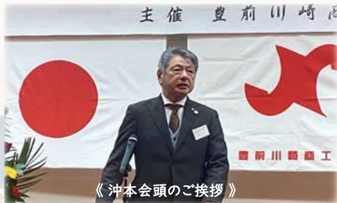
《 沖本会頭のご挨拶 》

短時間ではありましたが、賑やかに、無事終了しました。ご参加いただきました皆様にはお礼を申し上げます。