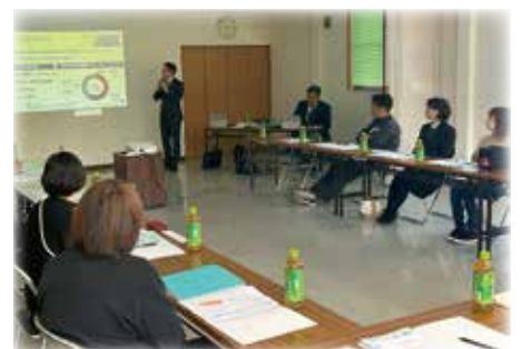
《 フォーラムの様子 》

アクサ生命は、全国の商工会議所会員企業などの福利厚生制度(退職金制度や弔慰金・見舞金制度、リスク対策や事業承継など)を、生命保険でサポートしています。また、経営者・従業員の皆さま向けの個人の自助努力による財産形成、医療保障、生活保障などのニーズにお応えする各種プランもご用意しています。