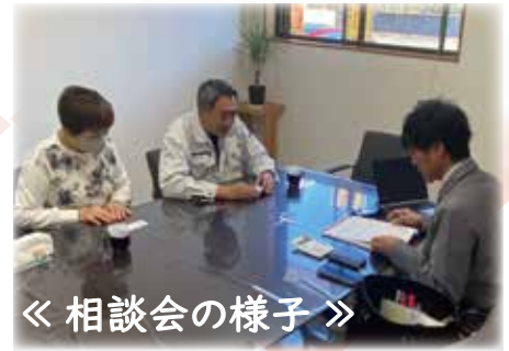
《 相談会の様子 》

商工会議所が主催する専門家との個別相談会は、あなたのビジネスをサポートし、成長を加速する絶好の機会です。各分野の専門家が親身になってアドバイスを提供し、具体的な解決策をご提案します！