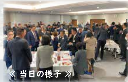
《 当日の様子 》